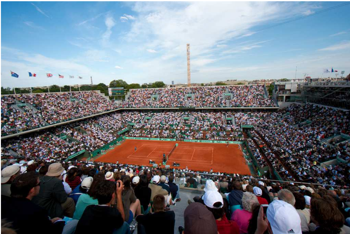
Court Philippe Chatrier

Je vous donne rendez-vous dans une deuxième partie pour corriger ce qui peut l'être et enfin parvenir à déterminer quels joueurs et joueuses ont été les plus réguliers en Grand Chelem.